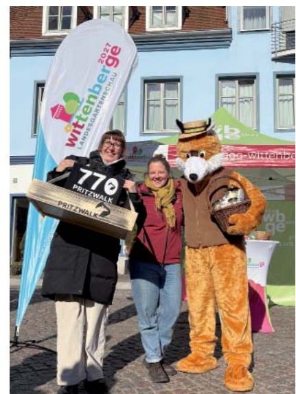
Der Auftakt der Wochenmarkt-Saison war für die LaGa schon am 5. März beim Surnhansen-Markt in Perleberg zum Abschluss der Knieperkohl-Saison.

Zudem ist die LaGa bei thematischen Sondermärkten präsent – erstmals am 8. Mai 2026 beim Sondermarkt „Alles rund um den Spargel“.