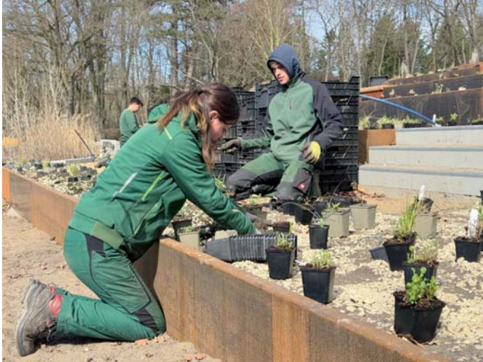
Die neu entstandene Pflanzterrasse am Schwanenteich soll zur LaGa 2027 als grünes Amphitheater sogar begehbar sein.