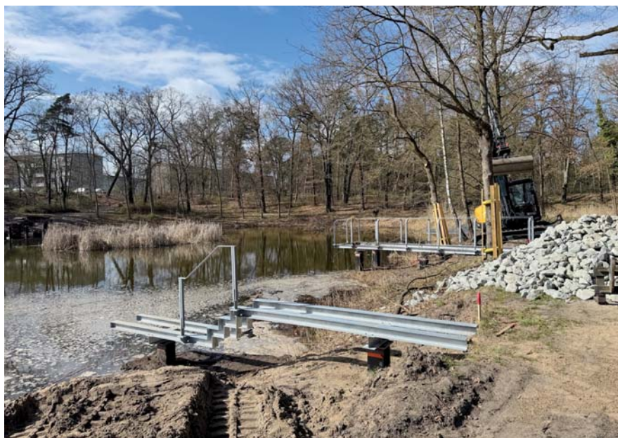
Im Uferbereich schreiten die Arbeiten an den Stegkonstruktionen sichtlich voran: Diese Stege laden Besucher künftig zum Verweilen sowie zur Beobachtung der Flora und Fauna ein.