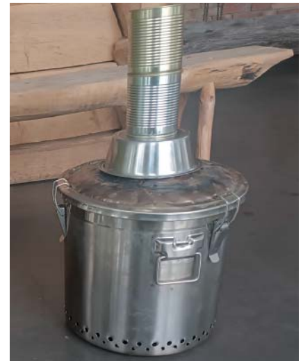
Im Workshop wird u.a. erklärt, wie man einen einfachen Pyrolyseofen selbst und kostengünstig bauen kann.

Da die Plätze am Workshop auf maximal zwölf Personen begrenzt ist, empfiehlt sich eine rechtzeitige Anmeldung über info@atz-welzow.de oder telefonisch unter (035751) 28224. Nicht minder interessant ist am 18. April „Die kleine Wildkräuterküche, in der gemeinsam gesammelt, gekocht und gegessen wird.“ ps