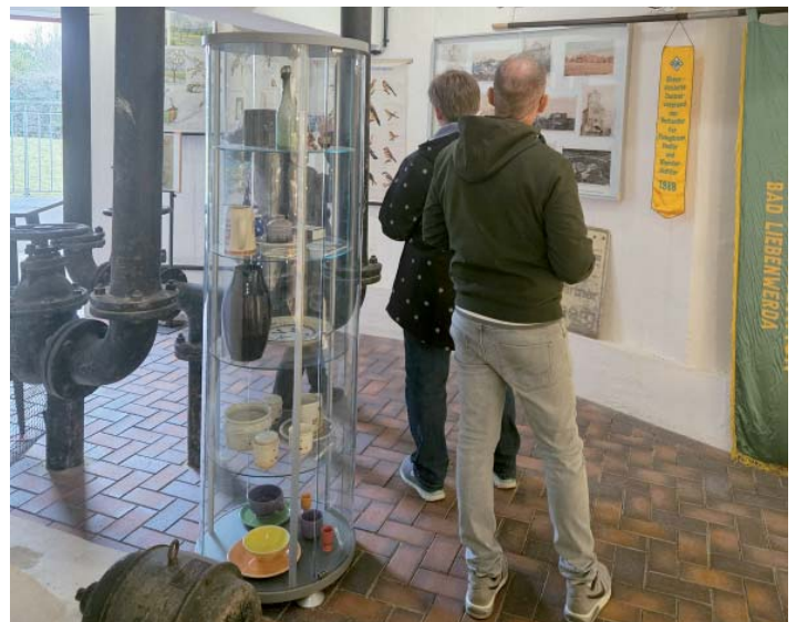
Der Zeitplan erlaubte den angehenden Fachberatern auch den Aufstieg auf den Winterberg und die Besichtigung der Heimatstube.