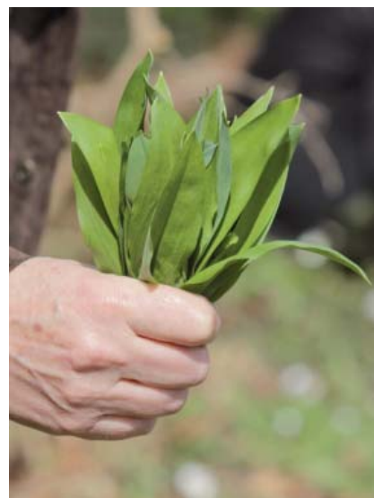
Eine Hand frischer Bärlauchblätter verhilft dem Gugelhupf zu einem einzigartigen Geschmack.