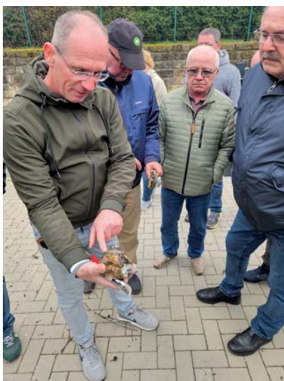
Erst beim Baumschnitt wird ersichtlich, wie Krankheitserreger und Schädlinge bereits der Gesundheit des Holzes zugesetzt haben.