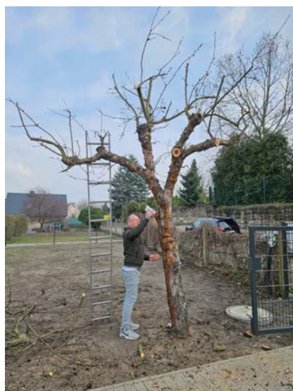
Der Wundverschluss hilft dem Baum, dass die Schnittstellen gut verheilen und Krankheitserregern nicht als Einfallstor dienen.