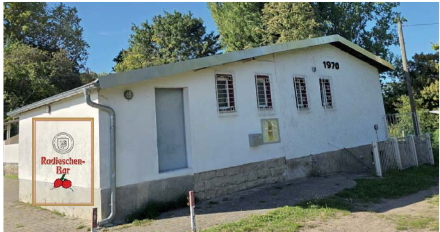
Die Radieschen-Bar im KGV „Bergfrieden“ Kirchmöser entwickelt sich immer mehr zu einem Treffpunkt nicht nur für Garten- und Naturfreunde und zu einem Veranstaltungsort. Foto: