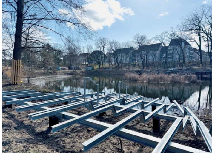
Auch die großzügigen Aufenthaltsplattformen sind bereits in ihren künftigen Ausmaßen zu erahnen und sollen als Erholungsorte dienen.